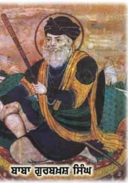
ਬਾਬਾ ਗੁਰਬਖਸ਼ ਸਿੰਘ

5 ਫਰਵਰੀ 1762 ਈਸਵੀਂ ਨੂੰ ਅਹਿਮਦ ਸ਼ਾਹ ਅਬਦਾਲੀ ਦੇ 6ਵੇਂ ਹਮਲੇ ਵੇਲੇ ਵੱਡਾ ਘੱਲੂਘਾਰਾ ਹੋਇਆ ਸੀ ਜਿਸ ਤੋਂ ਬਾਅਦ ਉਸ ਨੇ ਹਰਿਮੰਦਰ ਸਾਹਿਬ ਨੂੰ ਨੀਹਾਂ ਵਿੱਚ ਬਾਰੂਦ ਲਗਾ ਕੇ ਮੂਲੋਂ ਨਸ਼ਟ ਕਰ ਦਿੱਤਾ ਸੀ। ਪਰ ਘੱਲੂਘਾਰੇ ਤੋਂ ਸਿਰਫ 9 ਮਹੀਨੇ ਬਾਅਦ 18 ਅਕਤੂਬਰ 1762 ਈਸਵੀਂ ਨੂੰ ਦਲ ਖਾਲਸਾ ਨੇ ਪਿੱਪਲੀ ਸਾਹਿਬ (ਅੰਮ੍ਰਿਤਸਰ ਅਟਾਰੀ ਰੋਡ 'ਤੇ ਪੁਤਲੀਘਰ ਦੇ ਨਜ਼ਦੀਕ) ਦੀ ਜੰਗ ਵਿੱਚ ਅਬਦਾਲੀ ਨੂੰ ਹਰਾ ਪੰਜਾਬ ਵਿੱਚੋਂ ਕੱਢ ਦਿੱਤਾ ਸੀ ਅਬਦਾਲੀ ਦੇ ਜਾਣ ਤੋਂ ਬਾਅਦ ਸਿੱਖ ਅੰਮ੍ਰਿਤਸਰ ਵਿਖੇ ਇਕੱਠੇ ਹੋਏ ਤੇ ਦੁਬਾਰਾ ਹਰਿਮੰਦਰ ਸਾਹਿਬ ਦੀ ਨੀਂਹ ਰੱਖ ਕੇ ਉਸਾਰੀ ਸ਼ੁਰੂ ਕੀਤੀ ਗਈ। ਪਰ ਅਬਦਾਲੀ ਦੇ ਦਿਲ ਵਿੱਚ ਇਸ ਹਾਰ ਦਾ ਬਹੁਤ ਗਮ ਸੀ। 1764 ਈਸਵੀਂ ਵਿੱਚ ਉਹ ਆਪਣੇ 7ਵੇਂ ਹਮਲੇ ਦੇ ਰੂਪ ਵਿੱਚ ਭਾਰਤ ਵੱਲ ਚੱਲ ਪਿਆ ਤੇ 1 ਨਵੰਬਰ 1764 ਨੂੰ 60000 ਫੌਜ ਸਮੇਤ ਅਬਦਾਲੀ ਬਿਨਾਂ ਕਿਸੇ ਰੁਕਾਵਟ ਦੇ ਲਾਹੌਰ ਪਹੁੰਚ ਗਿਆ। ਲਾਹੌਰ ਤੇ ਕਬਜ਼ਾ ਜਮਾ ਕੇ 30 ਨਵੰਬਰ 1764 ਨੂੰ ਅਬਦਾਲੀ ਨੇ ਦਰਬਾਰ ਸਹਿਬ ਉੱਪਰ ਹਮਲਾ ਕੀਤਾ। ਉਥੇ ਹਾਜ਼ਰ ਸਿਰਫ ਤੀਹ ਸਿੱਖਾਂ ਨੇ ਭਾਈ ਗੁਰਬਖਸ਼ ਸਿੰਘ ਸ਼ਹੀਦ ਦੀ ਅਗਵਾਈ ਹੇਠ ਰਣਤੱਤੇ ਵਿੱਚ ਅਬਦਾਲੀ ਦੀ ਫੌਜ ਨਾਲ ਜੂਝ ਕੇ ਸ਼ਹਾਦਤ ਦਾ ਜਾਮ ਪੀਤਾ।