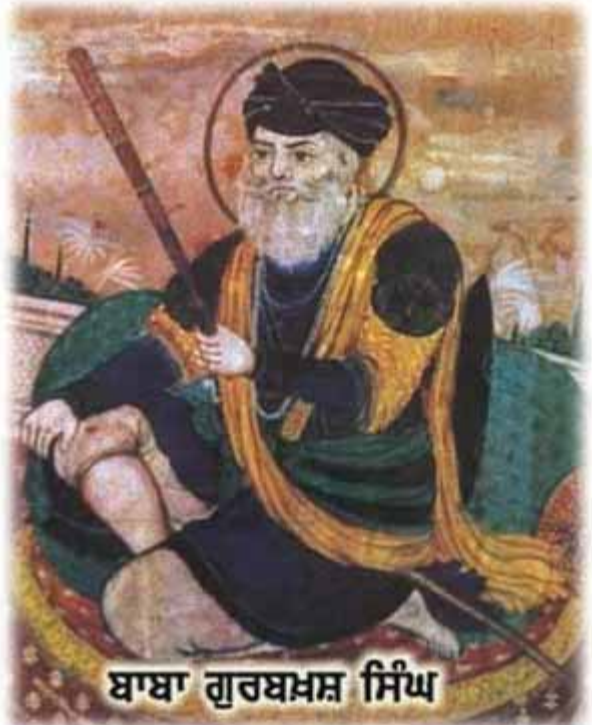
ਬਾਬਾ ਗੁਰਬਖਸ਼ ਸਿੰਘ

5 ਫਰਵਰੀ 1762 ਈਸਵੀ ਨੂੰ ਅਹਿਮਦ ਸ਼ਾਹ ਅਬਦਾਲੀ ਦੇ 6ਵੇਂ ਹਮਲੇ ਵੇਲੇ ਵੱਡਾ ਘੱਲੂਘਾਰਾ ਹੋਇਆ ਸੀ ਜਿਸ ਤੋਂ ਬਾਅਦ ਉਸ ਨੇ ਹਰਿਮੰਦਰ ਸਾਹਿਬ ਨੂੰ ਨੀਹਾਂ ਵਿੱਚ ਬਾਰੂਦ ਲਗਾ ਕੇ ਮੂਲੋਂ ਨਸ਼ਟ ਕਰ ਦਿੱਤਾ ਸੀ। ਪਰ ਘੱਲੂਘਾਰੇ ਤੋਂ ਸਿਰਫ 9 ਮਹੀਨੇ ਬਾਅਦ 18 ਅਕਤੂਬਰ 1762 ਈਸਵੀ ਨੂੰ ਦਲ ਖਾਲਸਾ ਨੇ ਪਿੱਪਲੀ ਸਾਹਿਬ (ਅੰਮ੍ਰਿਤਸਰ ਅਟਾਰੀ ਰੋਡ 'ਤੇ ਪੁਤਲੀਘਰ ਦੇ ਨਜ਼ਦੀਕ) ਦੀ ਜੰਗ ਵਿੱਚ ਅਬਦਾਲੀ ਨੂੰ ਹਰਾ ਪੰਜਾਬ ਵਿੱਚੋਂ ਕੱਢ ਦਿੱਤਾ ਸੀ ਅਬਦਾਲੀ ਦੇ ਜਾਣ ਤੋਂ ਬਾਅਦ ਸਿੱਖ ਅੰਮ੍ਰਿਤਸਰ ਵਿਖੇ ਇਕੱਠੇ ਹੋਏ ਤੇ ਦੁਬਾਰਾ ਹਰਿਮੰਦਰ ਸਾਹਿਬ ਦੀ ਨੀਂਹ ਰੱਖ ਕੇ ਉਸਾਰੀ ਸ਼ੁਰੂ ਕੀਤੀ ਗਈ। ਪਰ ਅਬਦਾਲੀ ਦੇ ਦਿਲ ਵਿੱਚ ਇਸ ਹਾਰ ਦਾ ਬਹੁਤ ਗਮ ਸੀ। 1764 ਈਸਵੀ ਵਿੱਚ ਉਹ ਆਪਣੇ 7ਵੇਂ ਹਮਲੇ ਦੇ ਰੂਪ ਵਿੱਚ ਭਾਰਤ ਵੱਲ ਚੱਲ ਪਿਆ ਤੇ 1 ਨਵੰਬਰ 1764 ਨੂੰ 60000 ਫੌਜ ਸਮੇਤ ਅਬਦਾਲੀ ਬਿਨਾਂ ਕਿਸੇ ਰੁਕਾਵਟ ਦੇ ਲਾਹੌਰ ਪਹੁੰਚ ਗਿਆ। ਲਾਹੌਰ ਤੇ ਕਬਜ਼ਾ ਜਮਾ ਕੇ 30 ਨਵੰਬਰ 1764 ਨੂੰ ਅਬਦਾਲੀ ਨੇ ਦਰਬਾਰ ਸਹਿਬ ਉੱਪਰ ਹਮਲਾ ਕੀਤਾ। ਉਥੇ ਹਾਜ਼ਰ ਸਿਰਫ ਤੀਹ ਸਿੱਖਾਂ ਨੇ ਭਾਈ ਗੁਰਬਖਸ਼ ਸਿੰਘ ਸ਼ਹੀਦ ਦੀ ਅਗਵਾਈ ਹੇਠ ਰਣਤੱਤੇ ਵਿੱਚ ਅਬਦਾਲੀ ਦੀ ਫੌਜ ਨਾਲ ਜੂਝ ਕੇ ਸ਼ਹਾਦਤ ਦਾ ਜਾਮ ਪੀਤਾ।